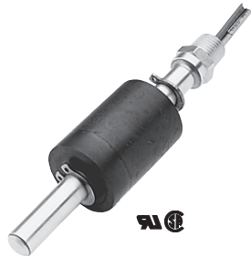
TH800 系列温度 / 液位开关

本产品将液位监控和温度开关集于一体。该产品尺寸适中。单点温度传感器位于主体的底部。