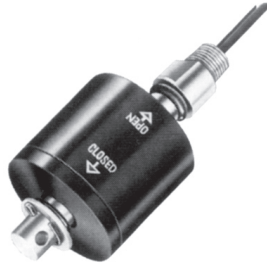
LS-38760 系列 - 带有软垫的浮子

带有软垫的浮子和开关，可适用于剧烈波动的液体。易于接地，是带卡车、建筑设备和需要移动应用场合的首选。