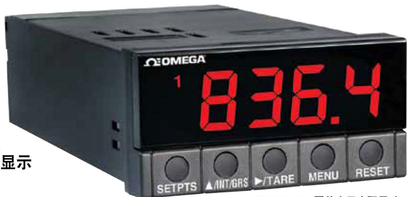
DP25B-S，图片小于实际尺寸。